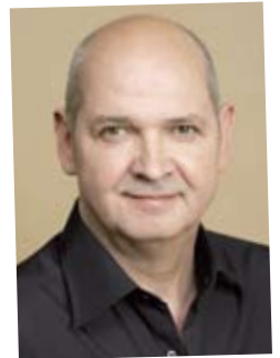
Jan Marijnissen, voorzitter SP

De SP is de derde partij van het land, en de grootste oppositiepartij in de Tweede Kamer. Meer dan anderhalf miljoen mensen steunen onze partij. Dat geeft vertrouwen. We werken dan ook keihard aan een menselijker en socialer Nederland. In de Tweede Kamer én in de steden en dorpen, samen met de mensen. Omdat wij uw steun daarbij hard nodig hebben, vraag ik u om lid te worden! U bent al lid voor 20 euro per jaar. U krijgt dan elke maand ons nieuwsblad De Tribune gratis in de bus.