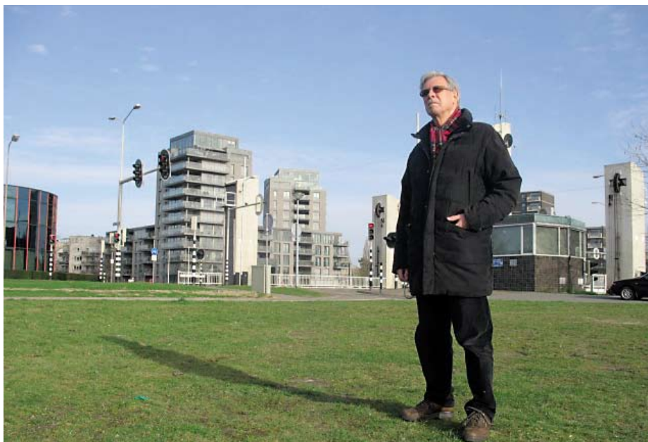
Beuvs: Bouw bij de Stadsbrug was waarschijnlijk goedkoper geweest.

Het nieuwe stadhuis is een heet hangijzer in Weert. En dan vooral de kosten. In de carnavalsoptocht van de Rogstaekers werd er met het onderwerp gespot. De SP is ook altijd erg kritisch geweest op dat nieuwe stadhuis, en nog steeds. Hoe zit het allemaal in elkaar? Een interview met SP-fractievoorzitter Herman Beuvs.