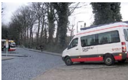
De bus moet beter!

Sinds enkele jaren is het busvervoer in Weert sterk verbeterd. Maar vervoers bedrijf Veolia en de gemeente doen weinig om daar bekendheid aan te geven. De bussen zitten steeds voller door mondtot-mond-reclame, maar nergens liggen folders met vertrektijden en een kaartje met de routes en de buslijnen. Van de uitgebreide promotiecampagne die de gemeente vorig jaar aankondigde is niets